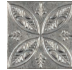
Aged Silver Ornato * 20x20 cm C-320