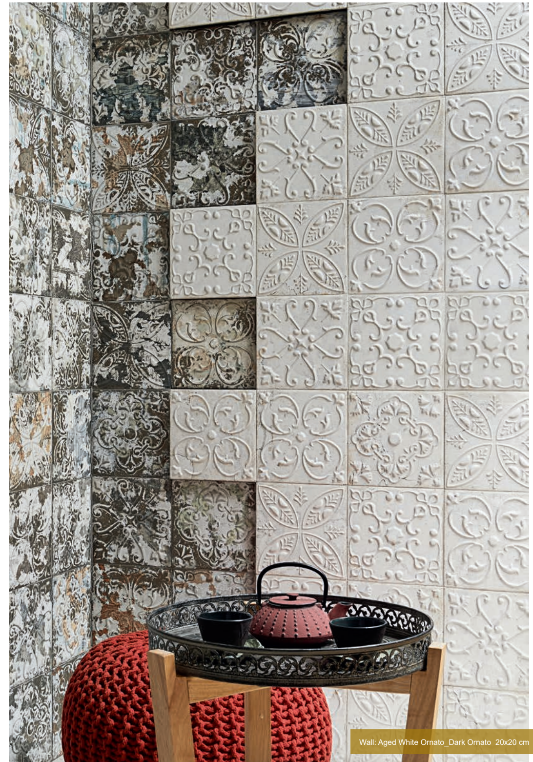
Wall: Aged White Ornato_Dark Ornato 20x20 cm

El PVD es uno de los campos de aplicación de la nanotecnología. El proceso consiste en depositar capas de átomos, en una cámara de alto vacío, sobre una superficie sólida. El recubrimiento se produce por la condensación de un metal vaporizado, oro, titanio, platino, ect. sobre el material a recubrir. Ventajas: Mayor resistencia al rayado y a la abrasión que los metales aplicados por cocción. Para la limpieza de estos materiales deben utilizarse productos no agresivos con pH neutro. No mezclar piezas de diferentes lotes.