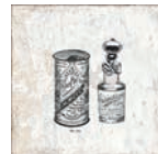
Aged Bath Decor ** 20x20 cm C-80

** Aged Bath Decor & Aged Kitchen Decor are available in 13 different aleatory patterns. Aged Bath Decor y Aged Kitchen Decor están disponibles en 13 diseños diferentes aleatorios.