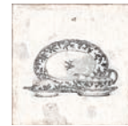
Aged Kitchen Decor ** 20x20 cm C-80