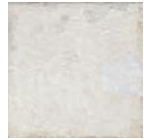
Aged White 20x20 cm C-430