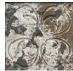
Aged Dark Ornato * 20x20 cm C-515