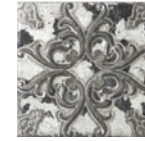
Aged Decor* 20x20 cm C-345

* Aged Decor is available in 3 different aleatory patterns. Aged Decor está disponible en 3 relieves diferentes aleatorios.