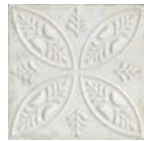
Aged White Ornato * 20x20 cm C-430

* Aged Ornato is available in 5 different aleatory reliefs. Aged Ornato está disponible en 5 relieves diferentes aleatorios.