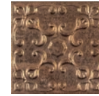
Aged Copper Ornato * 20x20 cm C-320