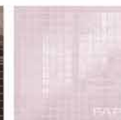
Pura Rosa Mosaico 30,5x30,5* TonosuTono 15 MAGNOLIA