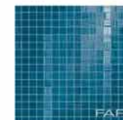
Pura Blu Mosaico 30,5x30,5* TonosuTono 08 BLU