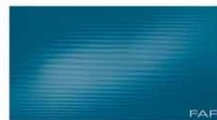
Pura Blu 30,5x56 RT TonosuTono 08 BLU