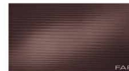
Pura Fondente 30,5x56 RT TonosuTono 14 MARRONE