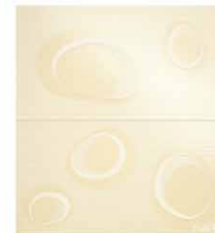
Pura Bolle Avana Inserto Mix 2 56x61 RT TonosuTono 01 BIANCO