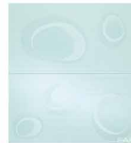
Pura Bolle Celeste Inserto Mix 2 56x61 RT TonosuTono 09 AZZURRO