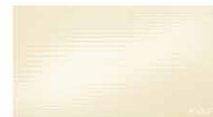
Pura Avara 30,5x56 RT TonosuTono 01 BIANCO