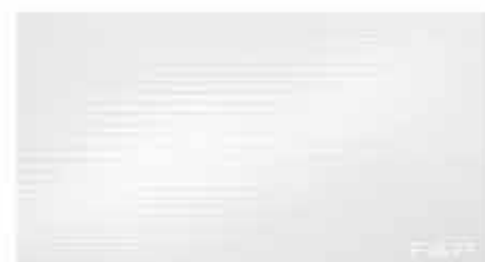
Pura Bianca 30,5x56 RT TonosuTono 01 BIANCO