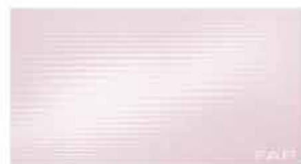
Pura Rosa 30,5x56 RT TonosuTono 15 MAGNOLIA