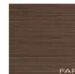
Pura Velvet Brown 30,5x30,5 RT TonosuTono 10 GRIGIO