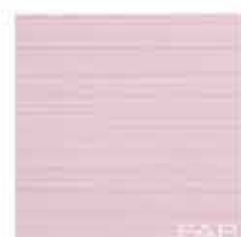
Pura Rosa 30,5x30,5 RT TonosuTono 15 MAGNOLIA