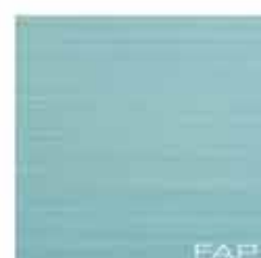
Velvet Blue 30,5x30,5 RT TonosuTono 09 AZZURRO