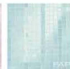
Pura Celeste Mosaico 30,5x30,5* TonosuTono 09 AZZURRO