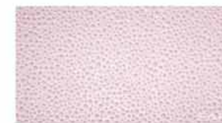
Pura Pieggi Rosa Inserto 30,5x56 RT TonosuTono 15 MAGNOLIA