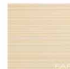
Pura Avara 30,5x30,5 RT TonosuTono 01 BIANCO