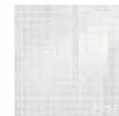
Pura Bianco Mosaico 30,5x30,5* TonosuTono 01 BIANCO