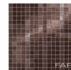
Pura Fondente Mosaico 30,5x30,5* TonosuTono 14 MARRONE