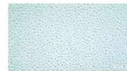
Pura Pieggi Celeste Inserto 30,5x56 RT TonosuTono 09 AZZURRO