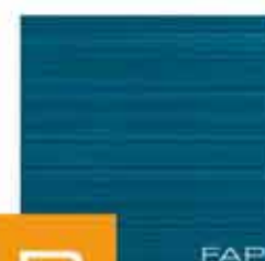
Pura Blu 30,5x30,5 RT TonosuTono 08 BLU