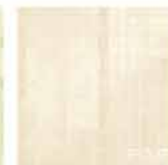
Pura Avana Mosaico 30,5x30,5* TonosuTono 01 BIANCO