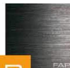
Pura Metal Argento 30,5x30,5 RT TonosuTono 12 NERO