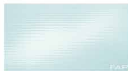
Pura Celeste 30,5x56 RT TonosuTono 09 AZZURRO