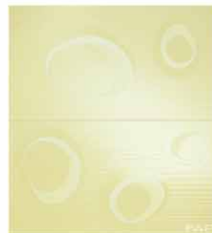
Pura Bolle Linfa Inserto Mix 2 56x61 RT TonosuTono 13 VERDE