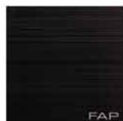
Pura Notte 30,5x30,5 RT TonosuTono 12 NERO