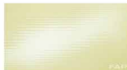
Pura Linfa 30,5x56 RT TonosuTono 13 VERDE