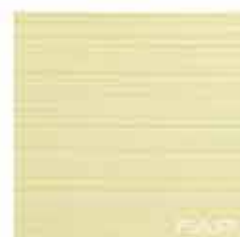
Pura Linfa 30,5x30,5 RT TonosuTono 13 VERDE