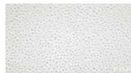
Pura Pieggi Bianca Inserto 30,5x56 RT TonosuTono 01 BIANCO