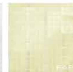
Pura Linfa Mosaico 30,5x30,5* TonosuTono 13 VERDE