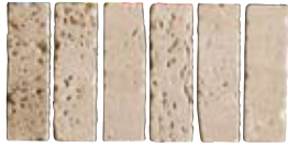
Fascia A 15x30 (6"x12")