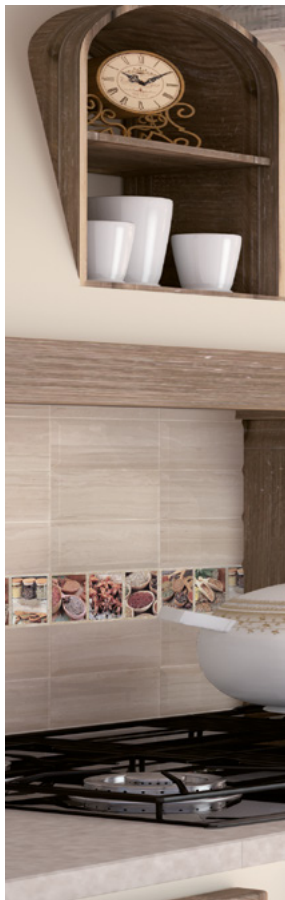
Wall Tiles: Creta Crema Bisel 10x30 & Exquisit A-B 10x30