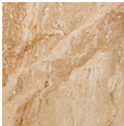
PAV. STONE MARRÓN 45X45 MPB10