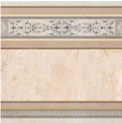
CENEFAS STONE POMPEYA 45X45 MPP260