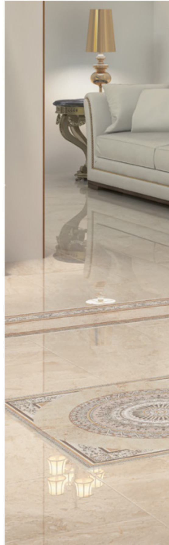
Floor Tiles: Pav. Stone Beige, Cenefas Stone Pompeya, Esquina Stone Pompeya & Rosetón Stone Pompeya 45x45