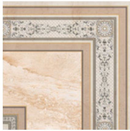
ESQUINA STONE POMPEYA 45X45 MPP260