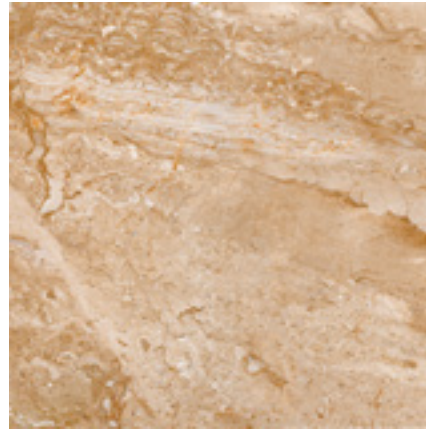
PAV. STONE MARRÓN 45X45 MPB10