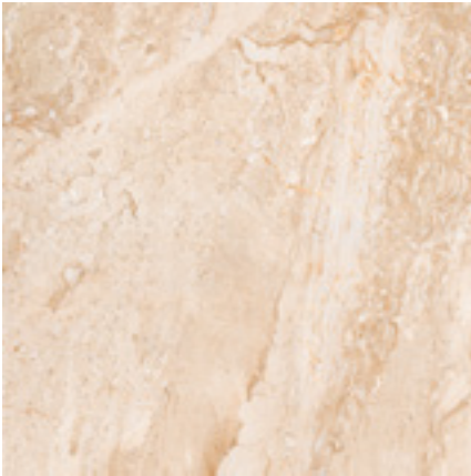
PAV. STONE BEIGE 45X45 MPB10