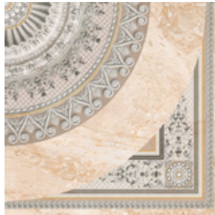
ROSETÓN STONE POMPEYA 45X45 MPP260