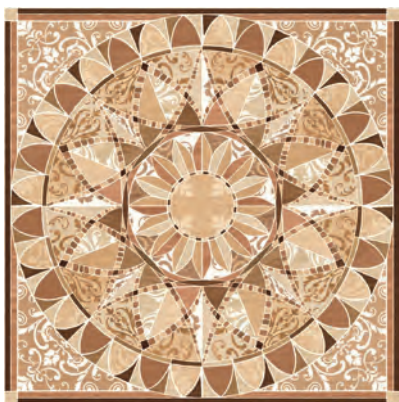
Rosetón OLITRE 1 7,40 60 x 60 P150 9.671.1.526