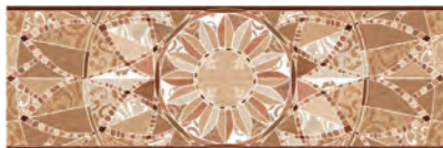
Cnf. OLITRE 4 9,88 20 x 60 P92 9.677.1.526