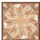
Taco OLITRE 6 4,86 20 x 20 P64 9.356.1.526

Piezas complementarias ver en pag 346 Special pieces see page 346 Pièces supplémentaires, voir page 346