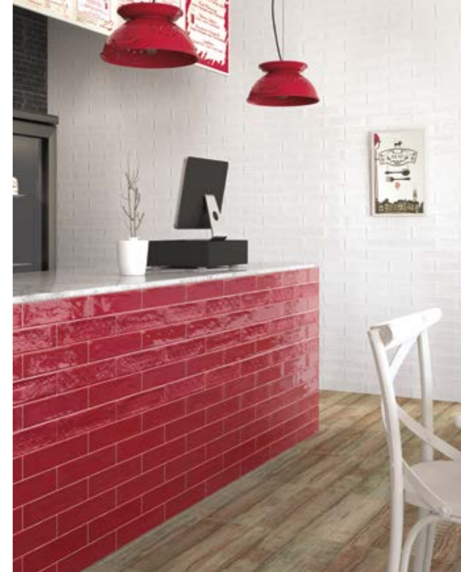
Gala Rojo 8x33,3 cm. · 3"x13" · Gala Rojo Decor 8x33,3 cm. · 3"x13" Gala Blanco 8x33,3 cm. · 3"x13" · Pav. Rosé 31x56 cm. · 12"x22"