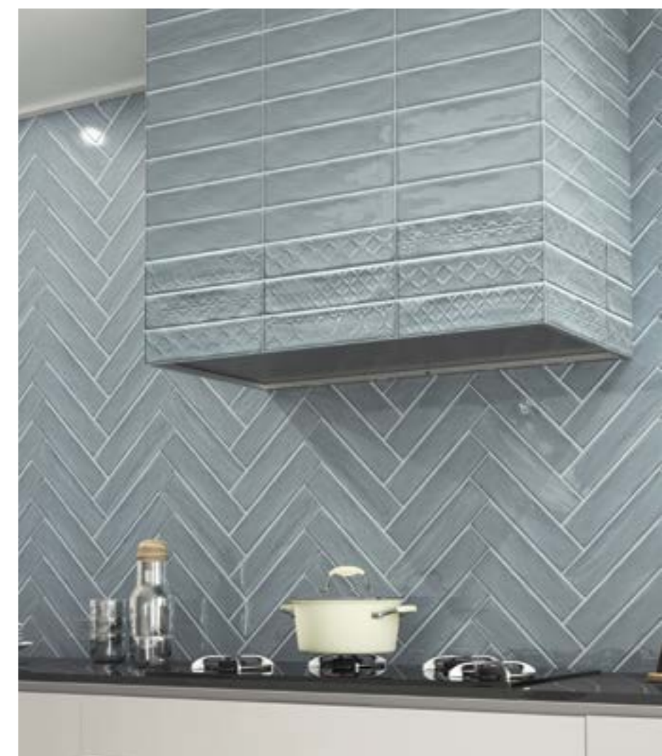
Gala Azul Decor 8x33,3 cm. · 3"x13" · Gala Azul 8x33,3 cm. · 3"x13"