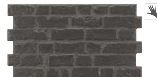
MANHATTAN ANTRACITA 31x56 cm. · 12"x22" K-28