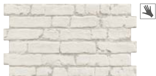
MANHATTAN BLANCO 31x56 cm. · 12"x22" K-28