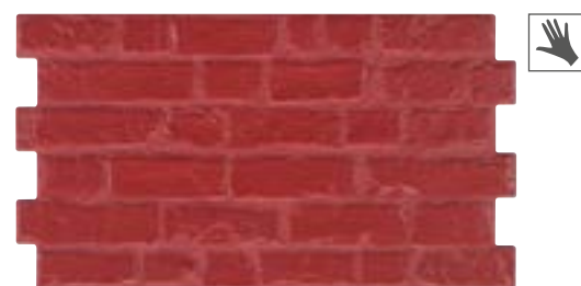
MANHATTAN ROJO 31x56 cm. · 12"x22" K-28