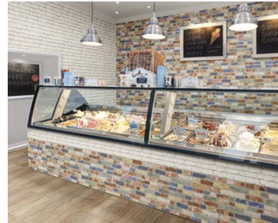
Manhattan Color 31x56 cm. · 12"x22" · Manhattan Blanco 31x56 cm. · 12"x22" · Pav. Rosé 31x56 cm. · 12"x22"