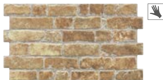
MANHATTAN OCRE 31x56 cm. · 12"x22" K-28