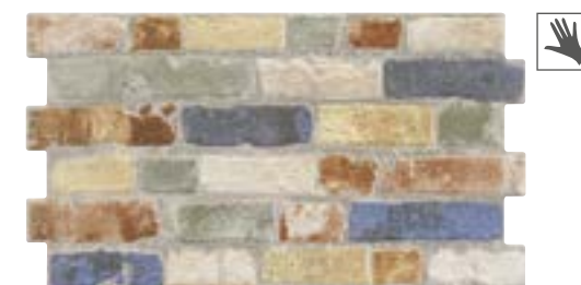
MANHATTAN COLOR 31x56 cm. · 12"x22" K-28