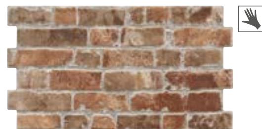
MANHATTAN COTTO 31x56 cm. · 12"x22" K-28