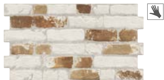
MANHATTAN OLD 31x56 cm. · 12"x22" K-28