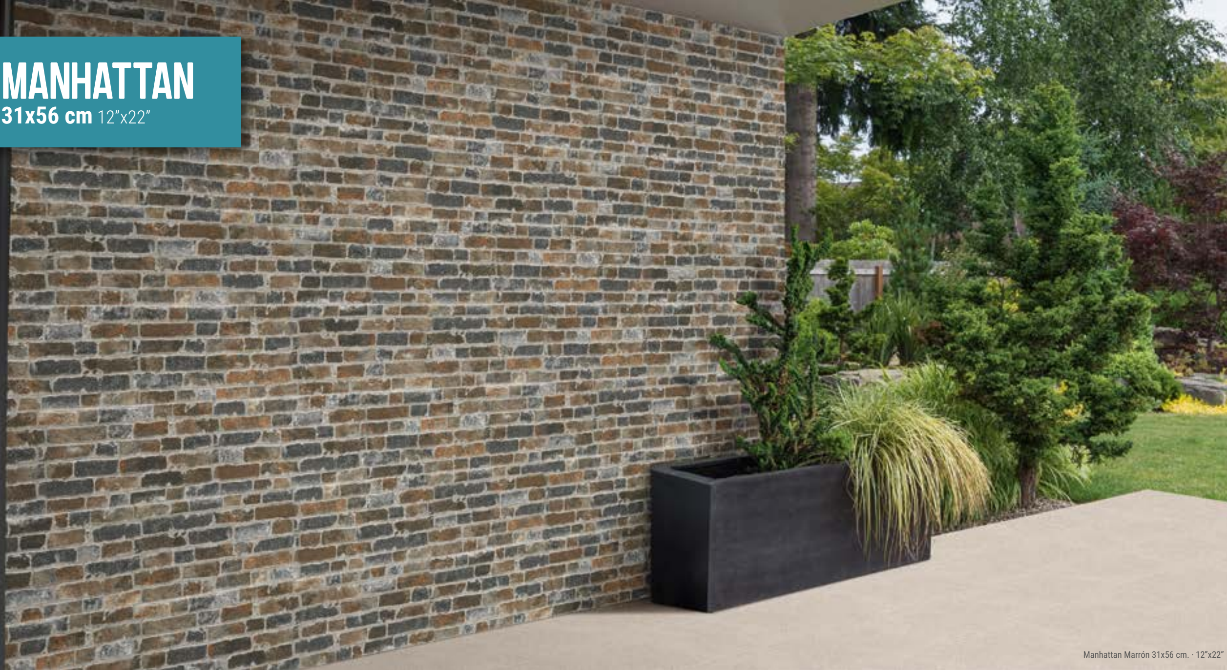
Manhattan Marrón 31x56 cm. · 12"x22"