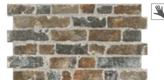
MANHATTAN MARRÓN 31x56 cm. · 12"x22" K-28