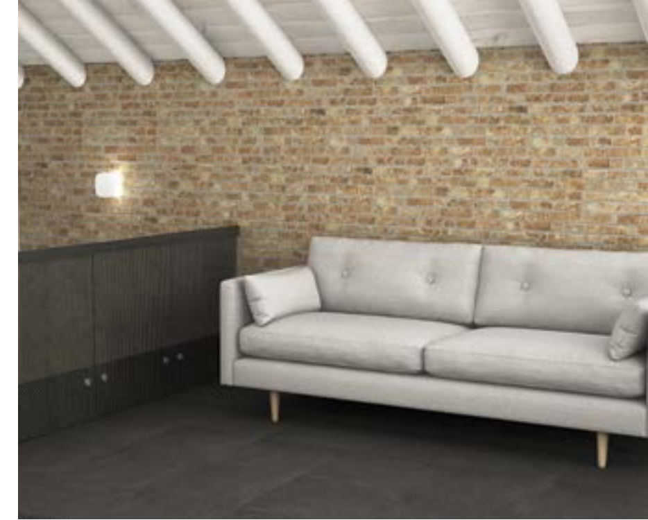
Manhattan Ocre 31x56 cm. · 12"x22"