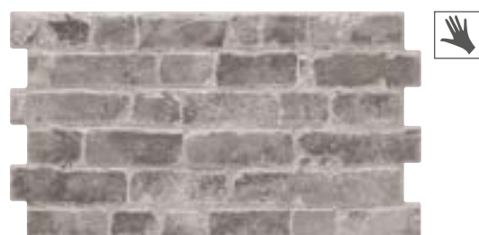
MANHATTAN CHARCOAL 31x56 cm. · 12"x22" K-28