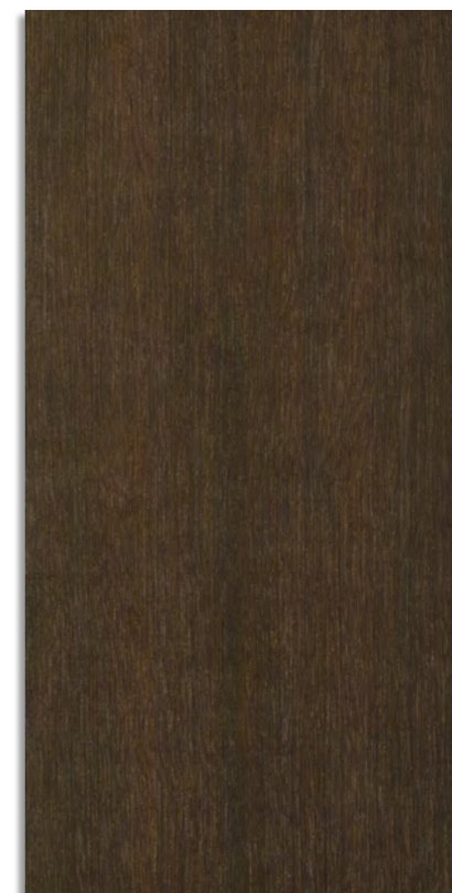
(6) JAMBIRE 60x120 RECT [ 59,2x118,4 cm]