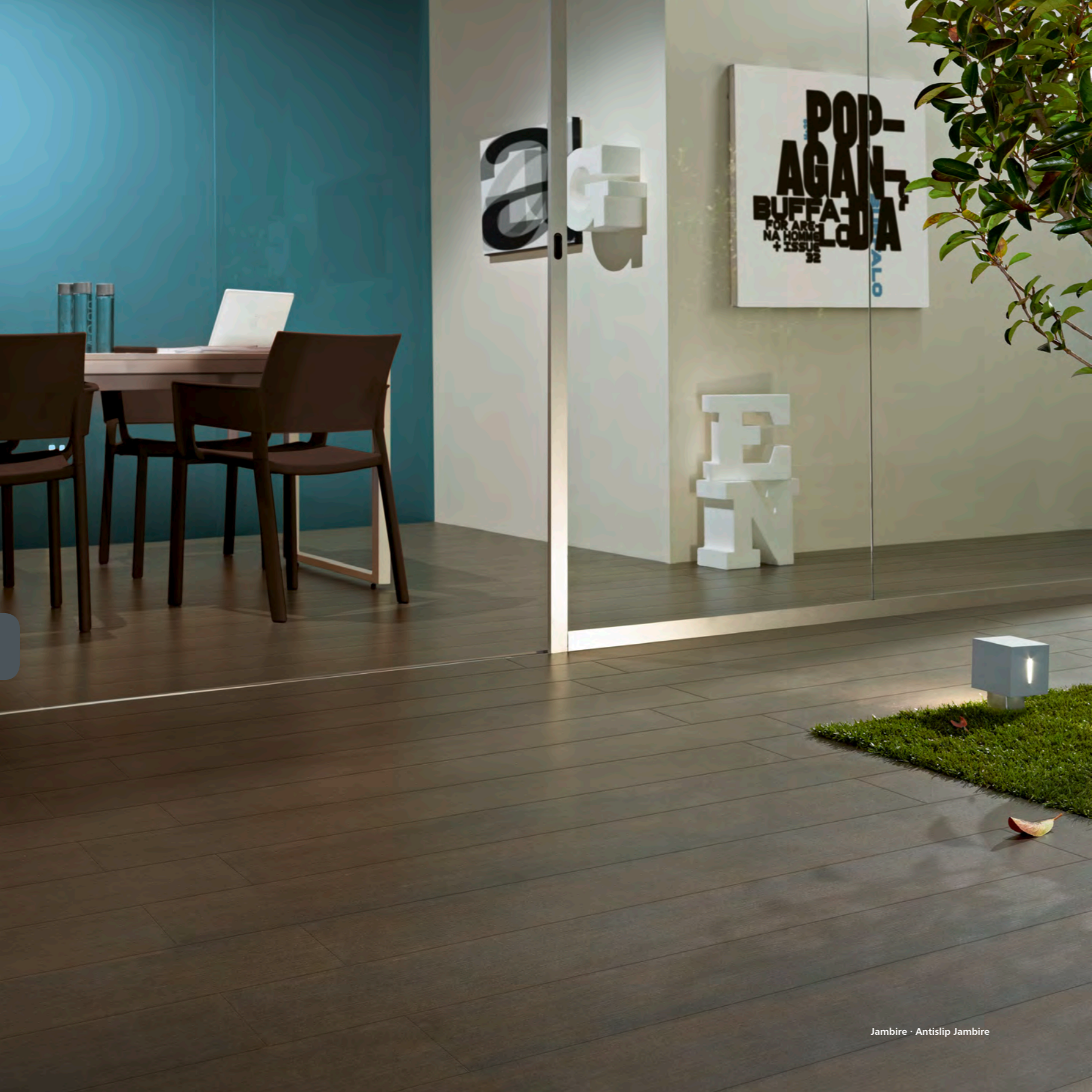
Jambire · Antislip Jambire