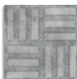
Norvins Cemento G.179 Antideslizante G.179