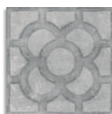
Acorn Cemento G.179 Antideslizante G.179