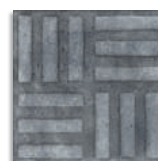
Norvins Grafito G.179 Antideslizante G.179