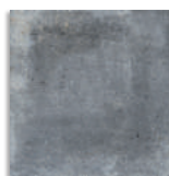
Orchard Grafito G.179 Antideslizante G.179