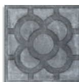
Acorn Grafito G.179 Antideslizante G.179