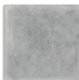
Orchard Cemento G.179 Antideslizante G.179